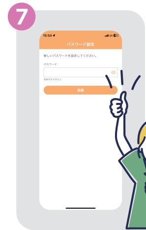
⑦ 入居者様ご自身で新しいパスワードを決定し入力これで完了です。