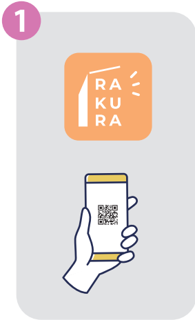
① 入居者アプリ「RAKURA」をインストール

RAKURAの登録はカンタン。アプリをインストールして必要事項を入力するだけ！ 今すぐ入居者アプリ「RAKURA」をインストールしましょう！