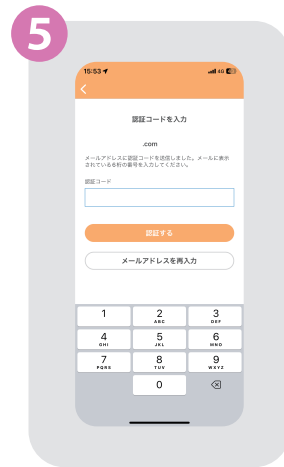
⑤ 認証コードを入力