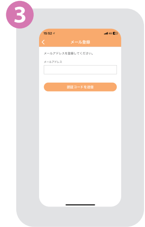
③ ご利用されているメールアドレスを入力