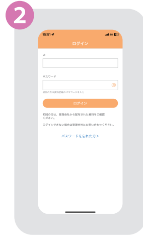
② アプリを開いてIDと初期パスワードを入力